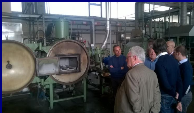
Due momenti della visita alla Sinterloy Srl