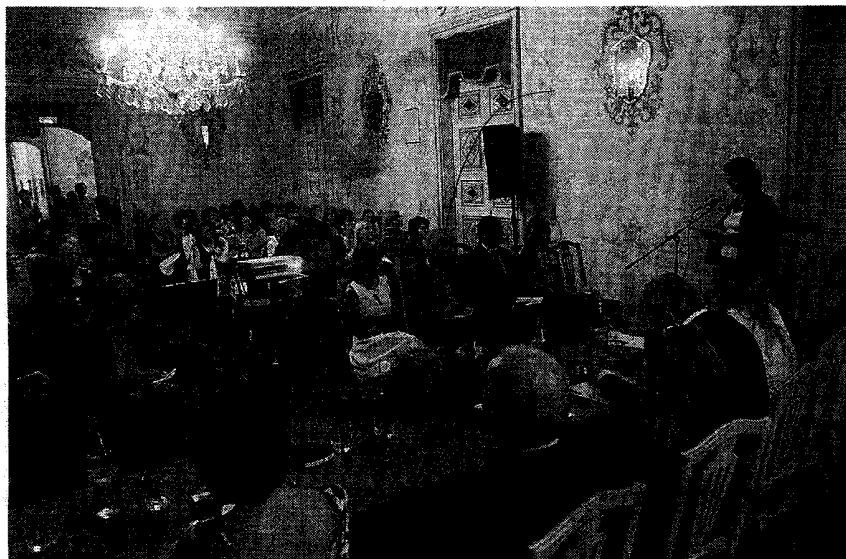
San Giorgio. Il pubblico al convegno dell'Aidda